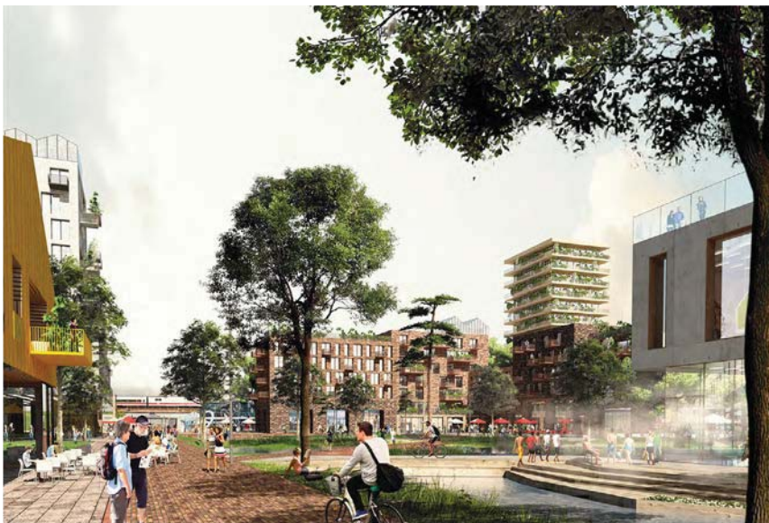
Zentraler Platz im BahnQuartier